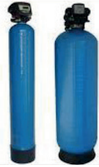
Yumuşatma ve Karbon Sistemi Softening And Carbon System