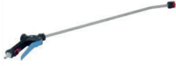
Klasik Köpük Tabancası Foam Gun