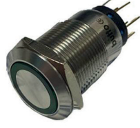
Paslanmaz Led Buton Stainless Led Buttons