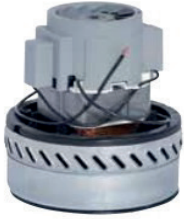
Süpürge Motoru Vacuum Engine