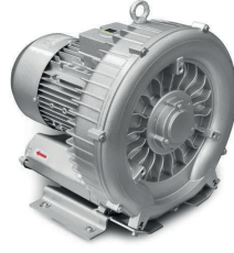
Blower Motor Blower Vacuum Engine