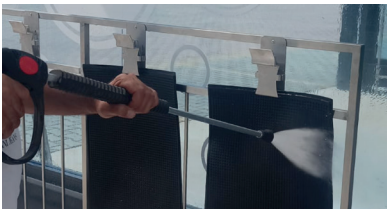
Paspas Tutucu Mandal Mop Holder Latch