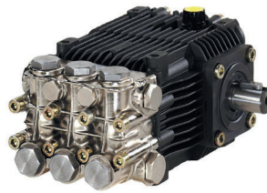
Annovi Reverberi Pompa Annovi Reverberi Pump