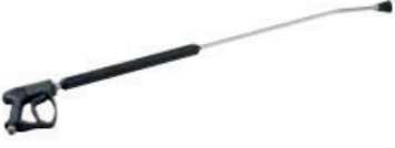
Tetikli Yıkama Tabancası Spray Gun With Trigger