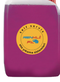
Vişne Çürüğü Cherry Rot