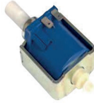
Mikro Dozaj Pompası Micro Dosage Pump