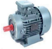
İndüksiyon Motoru 5,5-2,2 kW Induction Engine 5,5-2,2 kW