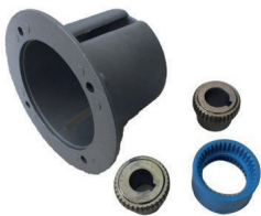
Flanş Kaplin Takımı Flange Connection Kit