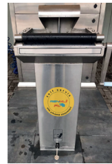
Lavabo Wash Stand