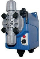
Elektrikli Dozaj Pompası Electric Dosing Pump