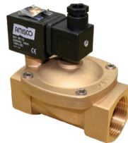
Selenoid Valf Solenoid Valve