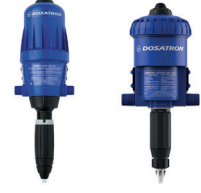
Mekanik Dozaj Pompası Dosing Pump Mechanical