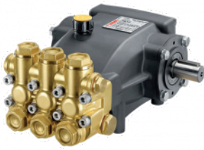
Hawk Pompa Hawk Pump