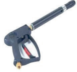
Jet Köpük Tabancası Spray Gun With Trigger